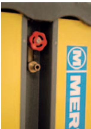
seitlicher Einbauschacht für Wasser- oder Druckluftanschlüsse