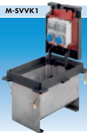
M-SVVK1/0-2-0 bestückt mit 2x CEE 16A/230V 3polig