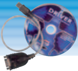
PM RS232-USB MZ 69533

für die PC-Anbindung des digitalen Multifunktionsmessgerätes der Serien PMD und PMKD inklusive PC-Software zur Datenabfrage und Konfigurierung. Passend für alle digitalen Prüftafeln. Durch diese optionale Schnittstelle können in der Prüfdatenverwaltungssoftware e-manager auch alle Funktionsdaten (Stromaufnahme, Wirkleistung usw.) verarbeitet werden.