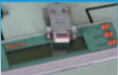
PM SRD 1 MZ 69560

für die externe Signalisierung des Betriebes des Prüfplatzes. Passend zu allen ortsfesten Prüftafeln zur Einrichtung eines Prüfplatzes gemäß VDE 0104 „Errichten und Betreiben elektrischer Prüfanlagen“.