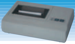
PM BD 1 MZ 69532