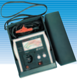
PM BRT 1 MZ 69531