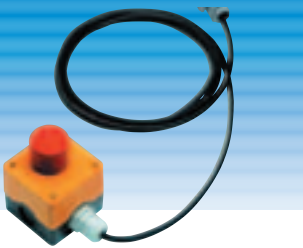
PMFI PNA MZ 69483